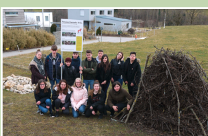
Bilder der prämierten Klassenprojekte April 2018.